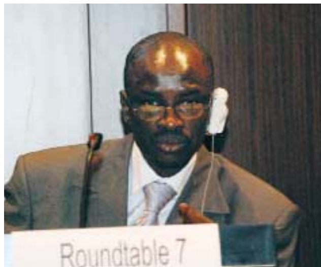
Un parlementaire sénégalais préside la table ronde sur la budgétisation sociale.

Les participants ont centré leur attention sur la nécessité de financer suffisamment les secteurs sociaux de manière à atteindre les OMD et les objectifs nationaux de développement et à améliorer l'efficacité de l'aide en harmonie avec l'Agenda d'Accra. Parce qu'ils sont souvent perçus comme «improductifs», les secteurs sociaux sont souvent dépourvus de ressources, ce qui a un impact négatif sur le développement social et économique à moyen et à long terme. La table ronde a conclu que les parlementaires jouent un rôle important dans le plaidoyer en faveur de la budgétisation sociale.