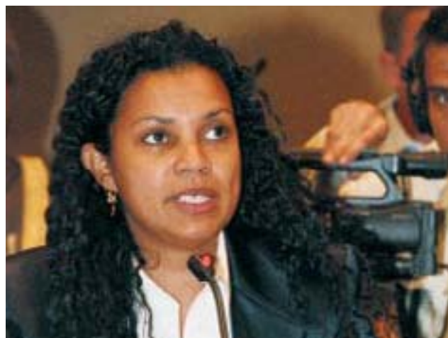
Une parlementaire néerlandaise préside la table ronde sur les changements climatiques.

Les participants ont noté que le manque d'accès à l'information, aux services et aux produits en matière de santé sexuelle et reproductive contribuait à modifier la dynamique de la population, ce qui retentit sur les changements climatiques et la dégradation de l'environnement. La production des aliments nécessaires à une population croissante contribue à l'épuisement des ressources naturelles, et la surface des terres arables diminue en raison de la baisse du niveau des nappes phréatiques, du surpâturage, de l'érosion des sols et de la hausse du niveau des mers. Pour faire face