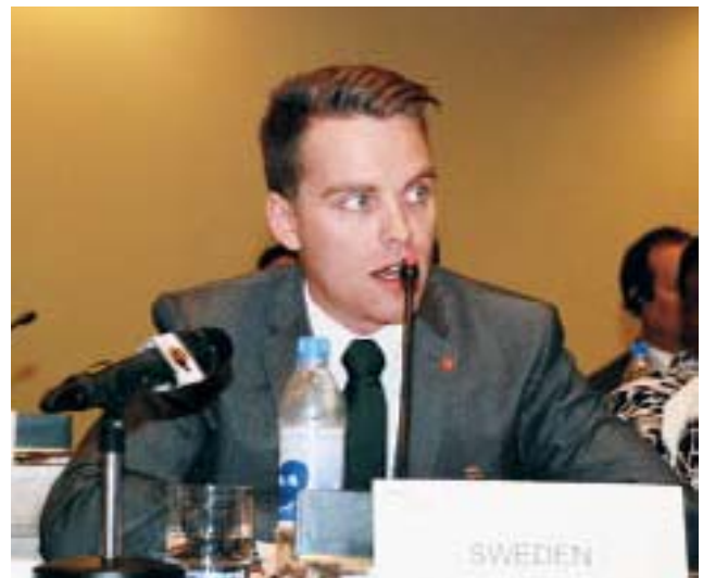
Un parlementaire suédois intervient de sa place.

tion d'éléments de Programme d'action de la CIPD et à conjuguer plusieurs forces. Par exemple, il s'agit d'indiquer aux enseignants de jardins d'enfants des approches pour mettre fin à la mutilation/coupe génitale féminine, de conduire des campagnes d'information publique, et de partager les informations entre parlementaires d'Amérique centrale pour faire échec à de récentes politiques de régression. Une initiative notable est intitulée "Le Parlement sur la route du village" en vertu de laquelle "Nous allons dans nos villages et rassemblons leurs points de vue." D'autres ont créé des commissions spéciales, tenu des audiences publiques ou des conférences parlementaires et organisé des voyages d'étude à l'intention de leurs collègues afin qu'ils puissent mieux comprendre les implications de leurs décisions. De nombreux parlementaires ont proposé et promulgué des lois afin de préserver les droits des personnes atteintes du VIH, de faire front à la violence à l'égard des femmes, d'offrir un congé payé aux jeunes parents des deux sexes et des allocations familiales, de réformer la législation relative au mariage et de promouvoir des lois sur l'égalité des chances.