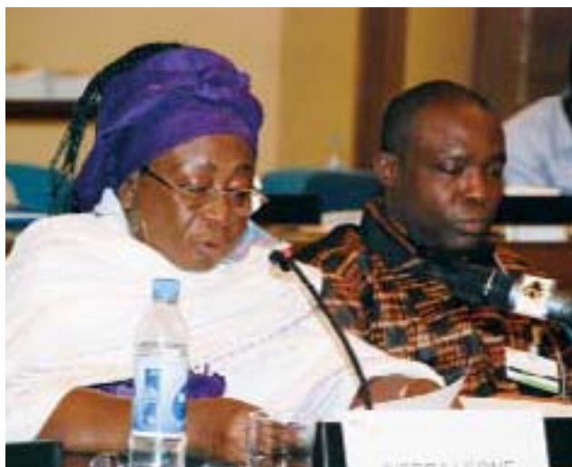
Une parlementaire sierra-léonienne intervient de sa place.