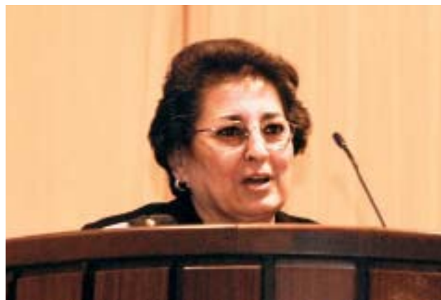
Thoraya Ahmed Obaid

Enfin, la conférence de cette année a été précédée par une réunion de haut niveau centrée sur les efforts nationaux accomplis pour améliorer la santé maternelle — qui est le cinquième OMD. Avec l'appui financier du Royaume des Pays-Bas, cette réunion de haut niveau a montré clairement que l'on peut et doit faire beaucoup plus pour sauver la vie des femmes et protéger leur santé et leur bien-être.