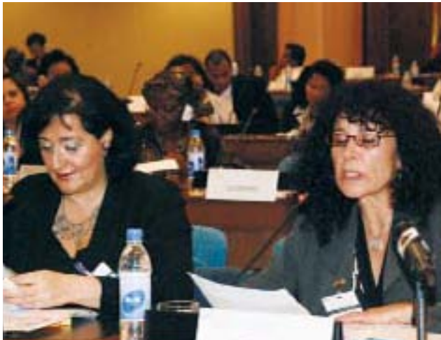
Une parlementaire bolivienne intervient de sa place.

postes de direction dans l'armée, le système judiciaire et le gouvernement. Pour plusieurs, les femmes n'occupent de positions d'autorité que depuis peu de temps, mais pour beaucoup d'autres elles représentent une force croissante au service de l'agenda de la CIPD. Certains pays ont créé des ministères ou des conseils spéciaux pour mettre expressément l'accent sur les problèmes concernant les femmes, les jeunes et les enfants. Un changement constitutionnel a représenté assez souvent une précieuse occasion à cet égard. Beaucoup d'intervenants ont reconnu l'avantage de liens avec la communauté internationale et le changement décisif qui résulte d'engagements pris par les pays donateurs; quelques-uns ont mentionné un retournement de politique, par exemple de la part des États-Unis. Si les États-Unis n'étaient pas représentés par des élus à la conférence, des membres du Département d'État américain ont prononcé une déclaration exprimant l'attachement renouvelé de leur pays à l'agenda de la CIPD, ce dont les parlementaires se sont félicités.