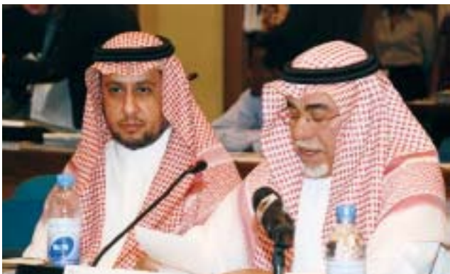
Un parlementaire saoudien intervient de sa place.