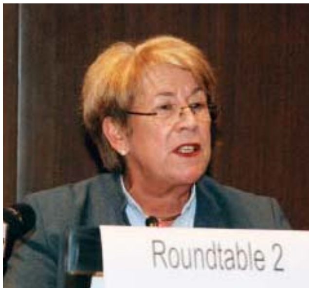
Une parlementaire française préside la table ronde sur l'égalité des sexes.