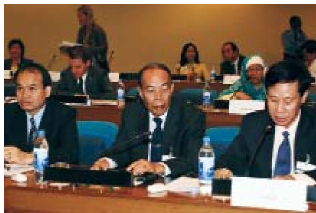
Un parlementaire laotien intervient de sa place.

tile) et l'OMD 5 (Améliorer la santé maternelle), points sur lesquels il est nécessaire d'agir plus énergiquement. Plusieurs participants ont déclaré qu'ils travaillaient à introduire des lois modèles sur la santé sexuelle et reproductive, souvent avec la collaboration de l'UNFPA. Beaucoup de parlementaires ont cité les progrès réalisés dans l'utilisation de contraceptifs et la santé maternelle. Cependant tous ont reconnu la nécessité de fournir des services accessibles et équitables, ainsi que des produits, afin de couvrir les besoins des femmes qui ne veulent pas être enceintes mais n'ont pas les moyens de prévenir une grossesse non désirée. On a aussi mis en relief la nécessité d'un accès élargi au diagnostic et au traitement des infections sexuellement transmissibles, dont le VIH. On a reconnu la nécessité de s'occuper de problèmes de santé connexes comme la fistule, les cancers de l'appareil génital, l'allaitement naturel et la santé mentale, et de satisfaire au besoin d'une contraception d'urgence et de préservatifs féminins. Plusieurs ont souligné les liens entre santé sexuelle et reproductive et d'autres problèmes de santé comme le paludisme, et insisté sur l'autonomisation des femmes et l'implication des hommes. Ils ont aussi reconnu que la réduction de la pauvreté suppose d'abord que l'on se préoccupe de la santé sexuelle et reproductive.