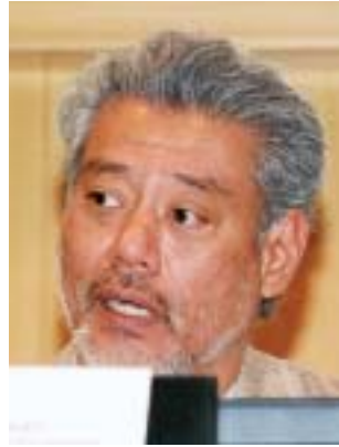
Jomo Kwame Sundaram

La crise alimentaire, a-t-il soutenu, était causée par la trop longue indifférence à l'égard des petits agriculteurs, par les subventions des pays riches aux biocarburants et par la libéralisation des échanges qui menaçait la sécurité alimentaire. Elle a été en outre aggravée par la fuite des capitaux, en 2007-2008, des marchés financiers vers les marchés des produits de base, qui a entraîné une augmentation des cours alimentaires. L'augmentation des cours de produits de base comme le blé, le maïs et le riz avait débouché sur une augmentation des cas d'insuffisance pondérale et de rachitisme chez les enfants et sur une baisse des taux de scolarisation. M. Sundaram a observé que l'impression générale était que la pauvreté avait diminué dans l'ensemble du monde au cours des deux dernières décennies, même si la manière de mesurer la pauvreté continuait de faire l'objet d'âpres discussions. D'autre part, les progrès avaient été généralement limités à l'Asie de l'Est, surtout la Chine. En Asie du Sud et en Afrique subsaharienne, beaucoup de besoins élémentaires ne sont pas satisfaits