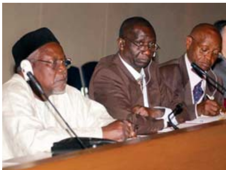
Parlamentarios de África intercambian ideas con el grupo