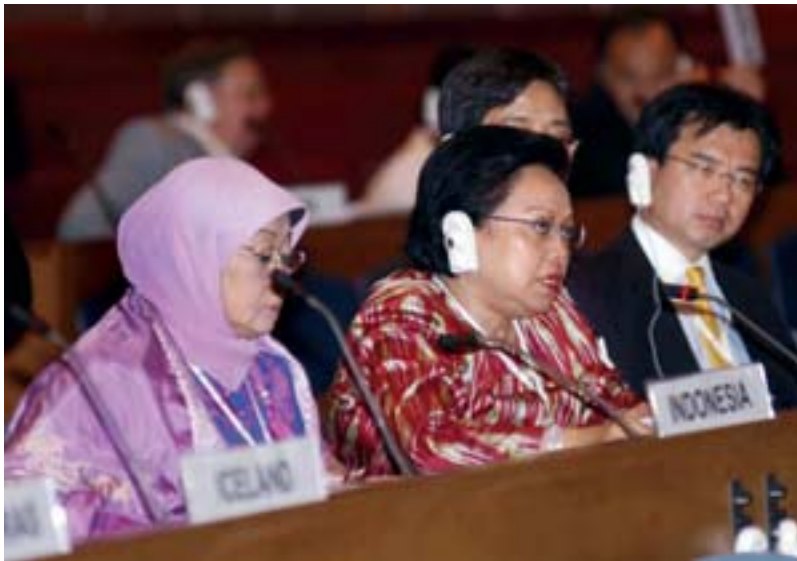
Una parlamentaria de Indonesia habla durante el plenario