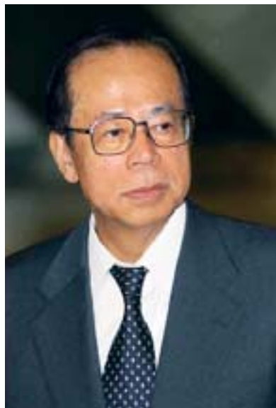
El Sr. Fukuda

exhorta a todos a “ser buenos, ser rectos, ser justos” y señaló que esto es imprescindible para lograr un desarrollo sostenible y mejorar las vidas y el bienestar de todas las personas del mundo.