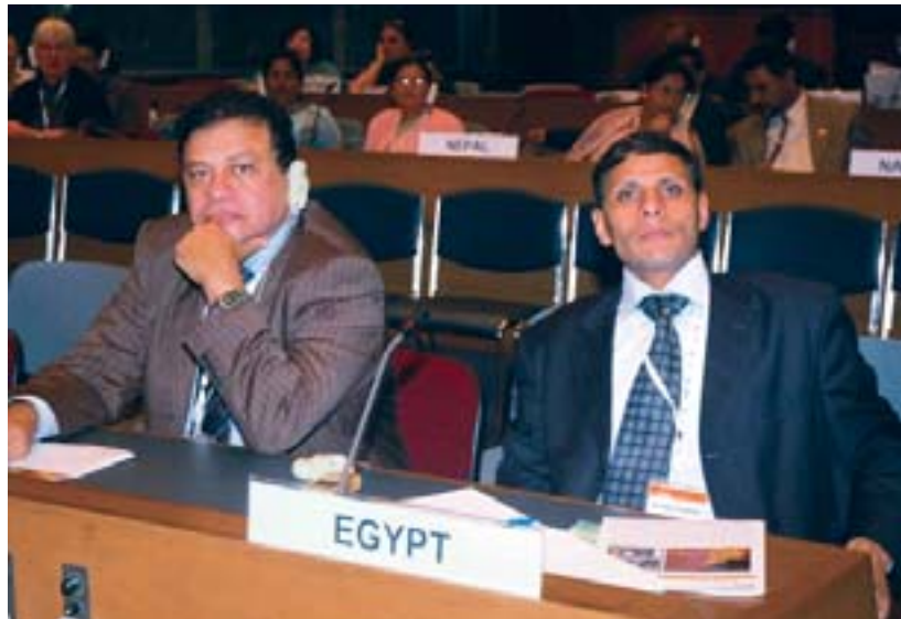
Parlamentarios de Egipto escuchan a los oradores en el plenario